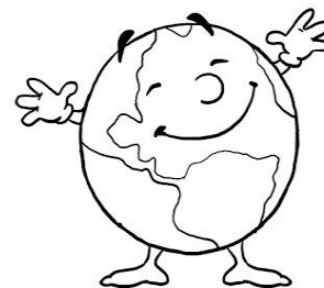
Imagem do mundo:

É que havia mesmo. E a pequenina bola de pingue-pongue queria conhecê-lo. Ser bola de futebol, de basquetebol não lhe bastava. O que ela queria era correr mundo!