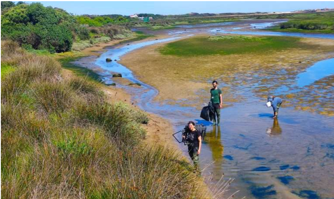
Os sapais têm uma capacidade 5 a 10 vezes maior de fixação de carbono do que outros ecossistemas como as florestas ou as florestas tropicais e por isso estão a ser alvo de um estudo em que participam investigadores da FCUP.

O Tratado do Alto-Mar, que tem ratificações suficientes para entrar em vigor e deverá ter a primeira reunião da COP em 2026, poderá suprir algumas dessas faltas, nomeadamente ao nível da proteção da biodiversidade marinha no oceano que fica para lá das zonas económicas exclusivas de cada país. Outra arma é o parecer histórico do Tribunal Internacional para a Lei do Mar, de 2024, que considerou que os gases com efeito de estufa são uma forma de poluição marinha, ao abrigo da definição da Convenção das Nações Unidas sobre o Direito do Mar (UNCLOS) e, por isso, os países estão obrigados a proteger o mar e o clima para lá das metas no Acordo de Paris .