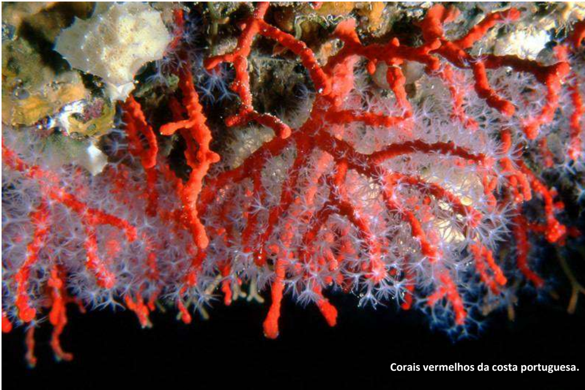
Corais vermelhos da costa portuguesa.

com os Estados-ilha do Pacífico, que estão entre os principais afetados pelas alterações climáticas . A subida do nível do mar fará desaparecer várias dessas ilhas, como Tuvalu, por exemplo”. “Isto pode dar uma tonalidade azul-oceânica à próxima COP, algo que a Fundação Oceano Azul vê com grande expectativa”, diz Pitta e Cunha. Fazer com que o oceano tenha um capítulo próprio, dedicado, nas negociações diplomáticas sobre as alterações climáticas é uma das principais metas da fundação, e é o âmagô do que levou os seus representantes a Belém do Pará.