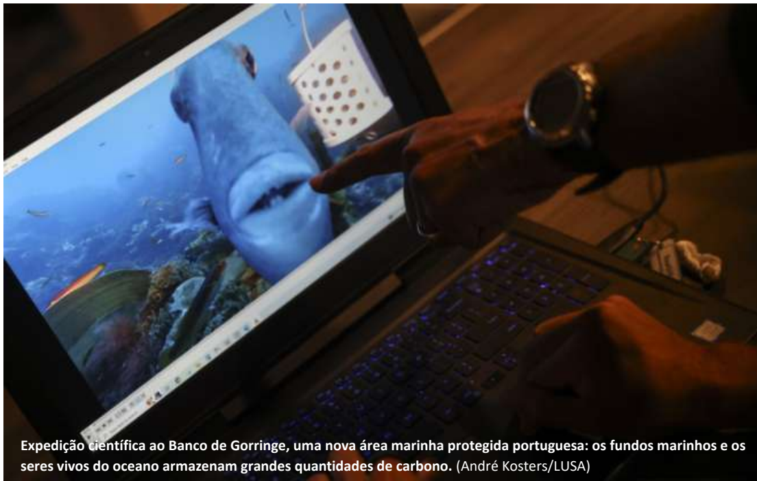
Expedição científica ao Banco de Gorringe, uma nova área marinha protegida portuguesa: os fundos marinhos e os seres vivos do oceano armazenam grandes quantidades de carbono.

A ministra do Ambiente e Energia, Maria da Graça Carvalho, expressou a mesma esperança, num jantar com nações e organizações “amigas do oceano”, depois de ter sido conhecido o acordo invulgar para pôr fim à disputa entre a Turquia e a Austrália pela organização da Conferência do Clima das Nações Unidas em 2026.