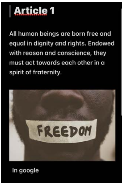
Filipa Monteiro, 1ªA