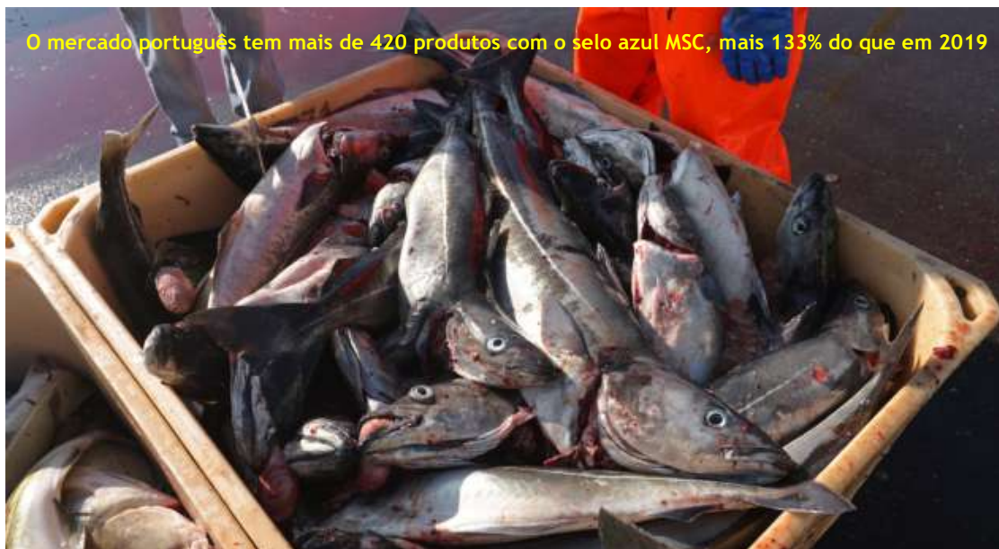
O mercado português tem mais de 420 produtos com o selo azul MSC, mais 133% do que em 2019

Segundo o relatório, publicado por ocasião do Dia Mundial dos Oceanos, que se assinalou no passado dia 8, os consumidores estão cada vez mais conscientes do impacto que as suas escolhas alimentares têm no planeta . Dos portugueses inquiridos 55% admitiu estar a mudar a dieta . A maior alteração verificou-se na carne vermelha, com 52% dos inquiridos a dizer que reduziu o consumo nos últimos dois anos. Ao mesmo tempo 40% disse estar a consumir mais legumes e 12% disse estar a consumir mais peixe.