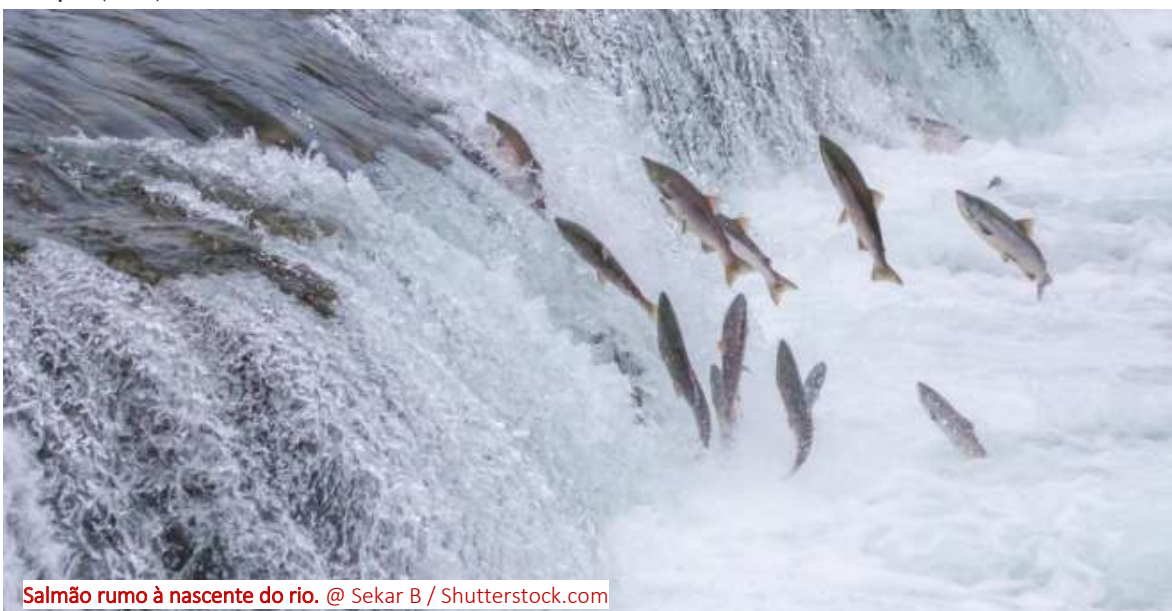
Salmão rumo à nascente do rio.

O colapso das populações de peixes migratórios ameaça a segurança alimentar de milhões de pessoas e os ecossistemas críticos de água doce, indica um relatório divulgado esta semana. Em vésperas do Dia Mundial da Migração de Peixes, no próximo sábado, dia 25 de maio, o documento salienta que desde 1970 se registou um declínio de 81% das populações de peixes migradores, sendo as quedas mais acentuadas na América Latina (91%), Caraíbas (91%) e Europa (75%).