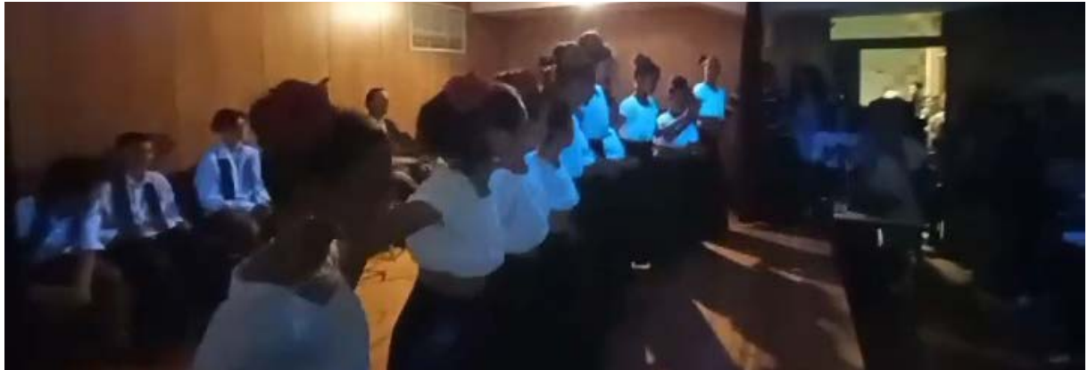
Abertura da cerimónia com o nosso grupo Flamenquitos de Sant' lago.