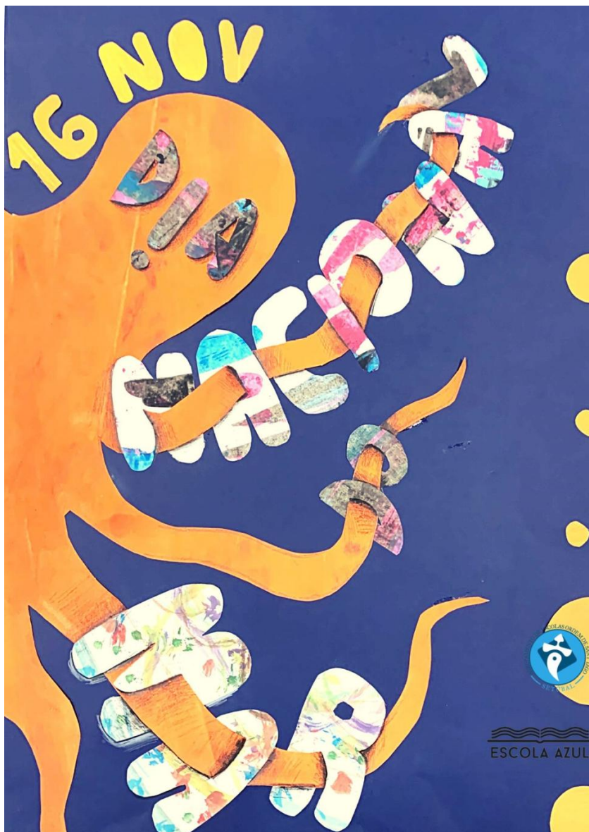
Cartaz elaborado pela turma E do 8º ano

O dia será comemorado na Escola Básica e Secundária Ordem de Sant'ago com a colaboração da Reserva Natural do Estuário do Sado, que irá realizar sessões sobre a importância das áreas protegidas da nossa região, perigos a que estão sujeitas e ainda fará a apresentação de espécies emblemáticas e espécies invasoras.