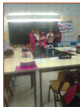
A apresentação do livro em sala de aula