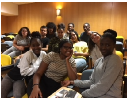
Os nossos atores - 10º e 11ºanos – Curso de Teatro