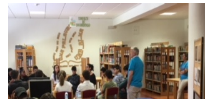
Dinamizadoras – Internas de Pediatria, Pneumologia e cardiologia