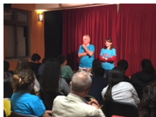
Médicos de Pediatria, Cardiologia e Pneumologia, debatendo e esclarecendo as temáticas abordadas nos sketches